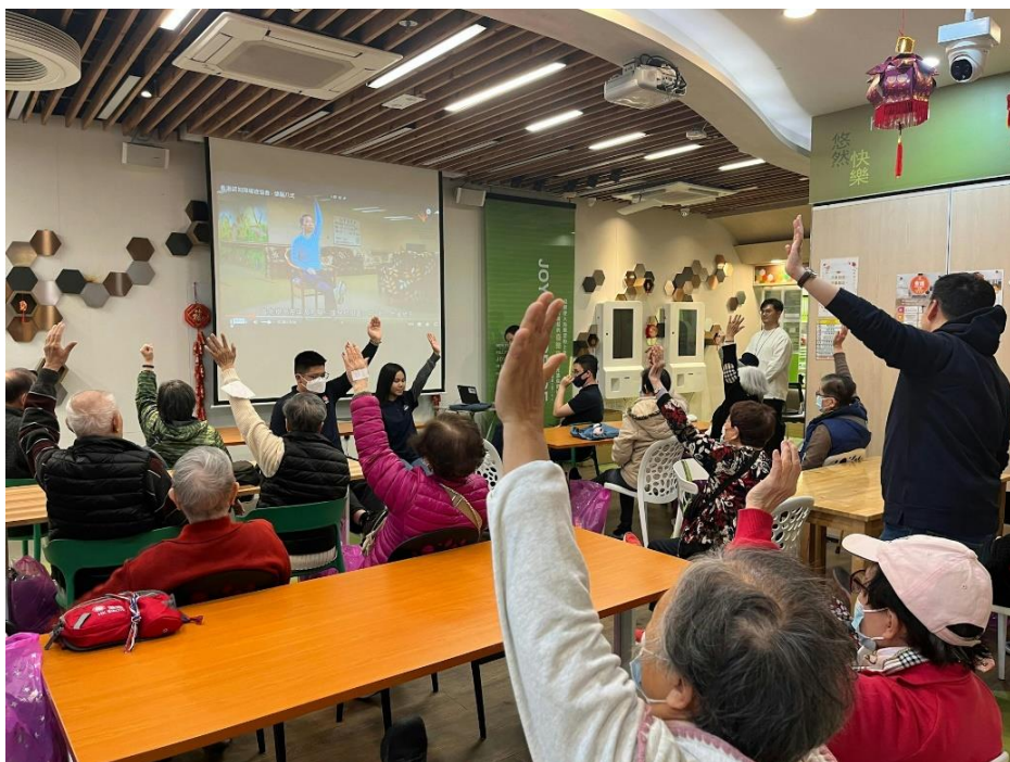
高主教書院與明愛合作，由一班長者為學生設計的 AI 工具優化產品設計