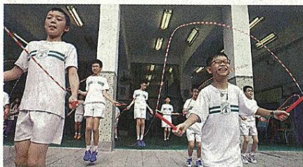
■「繩晨計畫」有助提升學生的體能之餘，也提升專注力。

現時部分有推行小班教學的官津中學，由於資源和課室等問題，只能在中、英、數等主科進行小班教